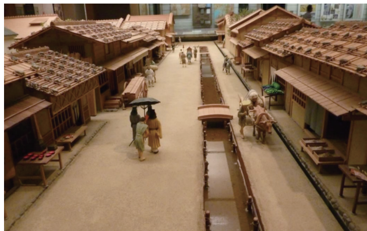
図2 洛中洛外図屏風に基づく戦国時代京都町並み復元模型 (国立歴史民俗博物館：著者による写真)

平安京の創立からおおよそ750年の後、戦国時代の日本の都の様子を有名な「洛中洛外図屏風」(図2)が鮮やかに伝えています。寺院や邸宅、築地塀に囲まれた施設も少なくないのですが、大通沿いに軒を接する商人や職人が住む町家が立ち並び、道に面する店舗が開かれ、にぎやかな街になっています。このように町家から構成された町並みは古代の都と対照的で、その出現が日本の中における市場経済の発展を反映する現象として捉えられています。このたいへん大きな変化がどのように行われたのか？ 創立期の都に、町