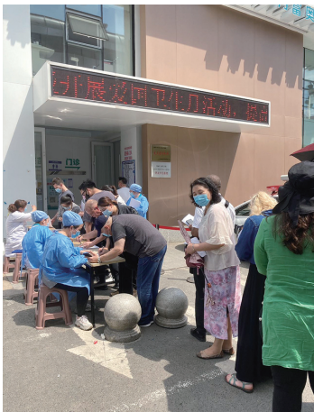
外国人居住者の新型コロナワクチン接種風景

2022年3月11日〜4月28日 長春がロックダウン。私は延吉に滞在していた。延吉のロックダウンは3月13日〜3月31日。長春市でロックダウンされていたら、私はどう生活していたか想像できない。食料の調達など、外国人の私には無理だった。親戚や友人たちもサポートできない状況だったそうだ。私は運よく延吉で、ビジネスホテ