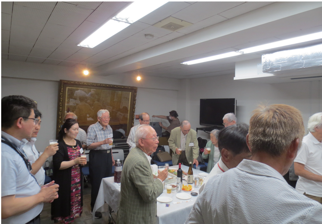
会員暑気払い（2023年7月28日）