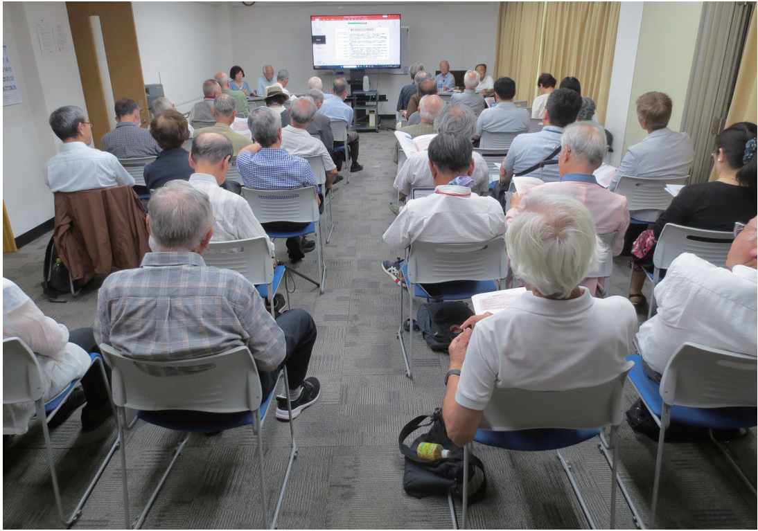
「将来検討委員会からの提言」会員説明会（2023年7月28日）