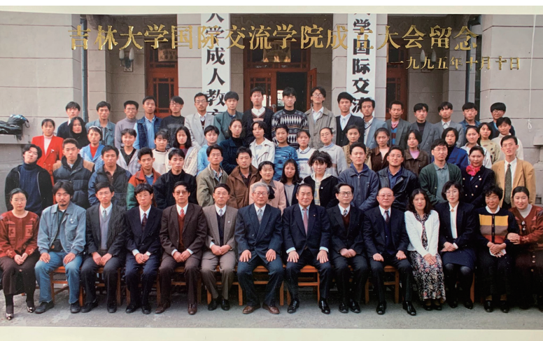
吉林大学国際交流学院入学式

中国を何度も添乗で訪れているうちに、どうしても中国語を学びたくなってきた。仙台市の日中友好協会が開催している中国語講座などでも中国語を学んだが、これはもう中国に留学するしかないという決意して、1995年秋、仙台市と友好都市である吉林省長春市にある吉林大学に晴れて留学した。国際交流学院第1期生となった。