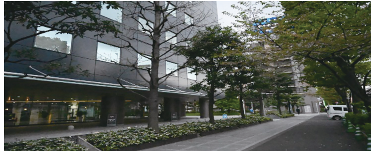
宏文学院の跡地は現在住友不動産飯田橋ビル3号館のエリアにあたる

間に、同校は留学生7192人を受け入れ、そのうち3810人が卒業し、中国の発展の中核を担う人材となった。その後、関東大震災により、宏