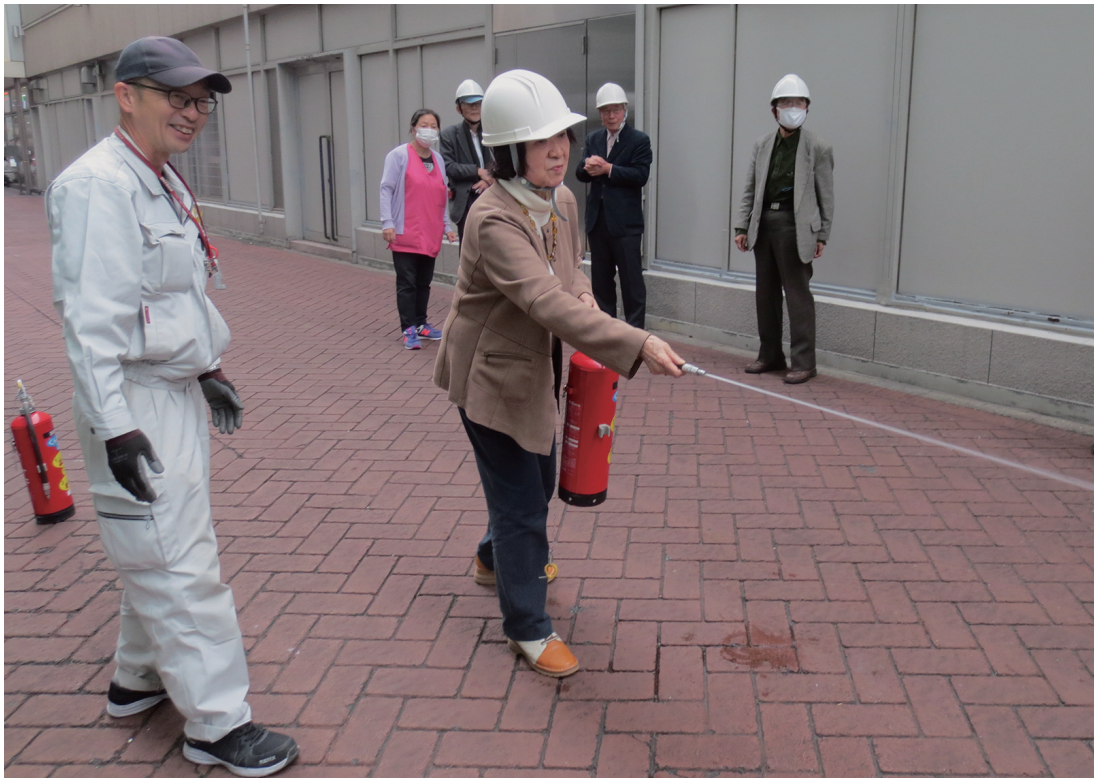
自衛消防訓練の様子（2023年11月16日）